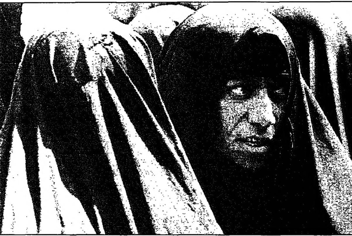
نشأة واشطن - من انخراط شلال عيسى

اعتمدت القيادة العراقية اس توصيات المجلس الوطني العراقي (البرلمان) بوقف التعاون مع لجنة الامم المتحدة الخاصة بالتحقيق في المذبحة العراقية (يونسكوب) ودعت مجلس الامن الى إلغاء قراره رقم 1449 الذي تم التصويت عليه في التاسع من ايلول (سبتمبر) الجاري.